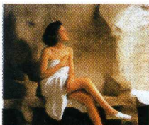
◆ Abano e Montegrotto