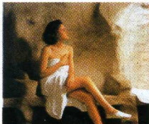
◆ Abano e Montegrotto