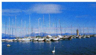
◆ Le meraviglie del Lago di Garda