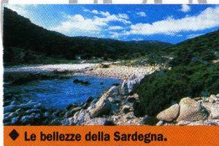
◆ Le bellezze della Sardegna.