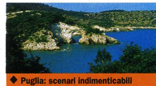
◆ Puglia: scenari indimenticabili