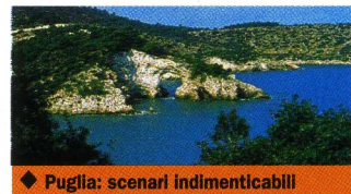
◆ Puglia: scenari indimenticabili