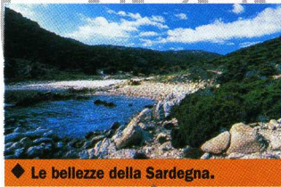
◆ Le bellezze della Sardegna.